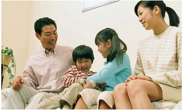
設備は間取り・部屋数・広さ・台所設備・浴室設備・住宅デザインに代表

「住宅市場動向調査報告書」の平成30年度版がこのほど、国土交通省から発表されました。住宅白書といわれるこの調査結果から、賃貸住宅入居者の今日の平均像が読み取れます。