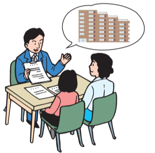
市場では、信頼できる不動産会社の窓口で、入念に説明を受けた上、契約されています

その調査によりますと、「賃貸住宅の選択理由」として、「家賃が適切だった」が最も多く、全体の50%を占め、次いで「住宅の立地環境が良かった」「住宅のデザイン・広さ・設備等が良かった」「昔から住んでいる地域だった」「親・子供などと同居・または近くに住んでいた」からが続き、これらがベスト5となっています。そして7位が「信頼できる不動産業者だった」と、過去5年間ほぼ同じ結果です。