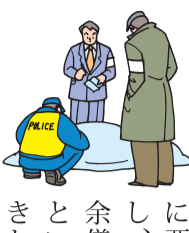
に悪影響を及ぼし、取り壊しを余儀なくされるということも起きかねません。

殺や他殺といった事件の後、事故物件化すれば入居者募集に苦戦して、借り手が遠のき、経営